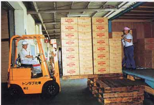
せいひんのおくりだし