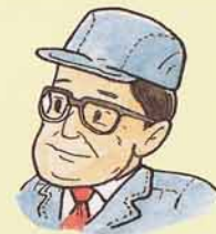
たばこ工場のおじさんのお話

できたせいひんは、郡山市内ばかりでなく、遠くの地方へトラックや貨車でおくり出しています。