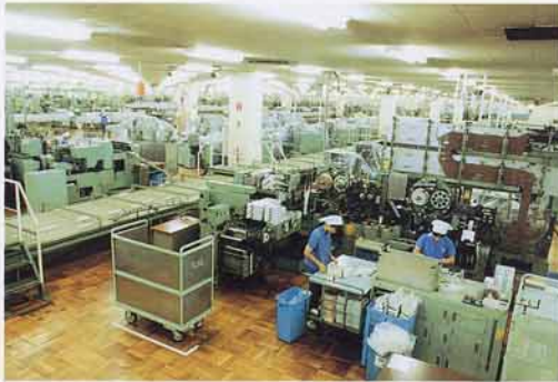
たばこ工場のようにす