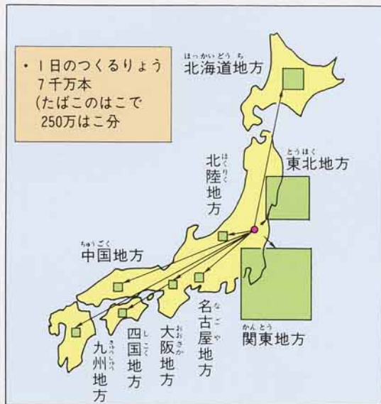
たばこせいひんのおくり先

ここでは、一日およそ七千万本のたばこをつくっています。一どにたくさんのかいをつくらするためにかいはつかっています。また、同じ形で同じしつのかいができるようにいっもけんさをしています。