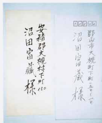
おじいさんに来た手紙