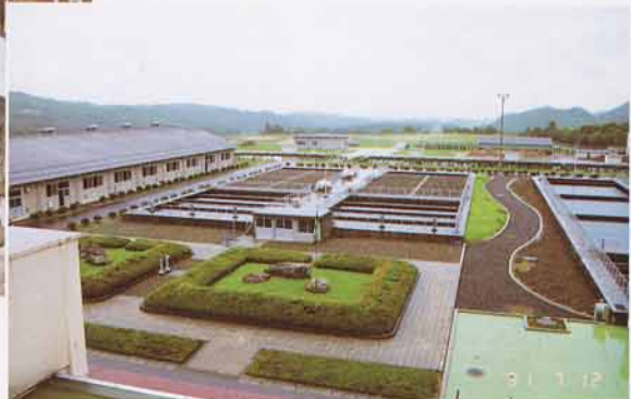
ほりぐち 堀口じょう水場