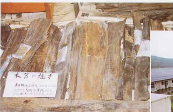
もっ かん 木管 たいせい (大成小の近くから出たもの)