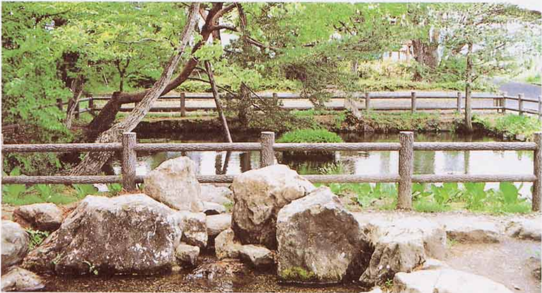
しづいけ 郡山市の水道のはっしょう地(清水池公園)