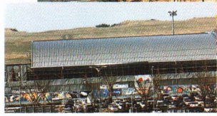
国際線ターミナルビルを増設中の福島空港ビル