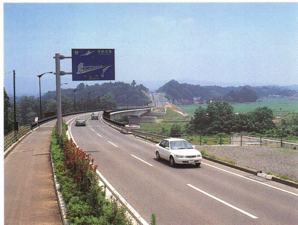
平成9年10月に全線開通した空港アクセス道路