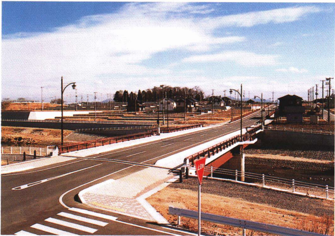
須賀川市が整備した「宮の杜ニュータウン」は、県中地域の新たな拠点都市として、郡山地域テクノポリス構想の母都市回廊ゾーンに位置しており、21世紀に向けた、産・学・住機能の調和した複合型のまちづくりを進めます。