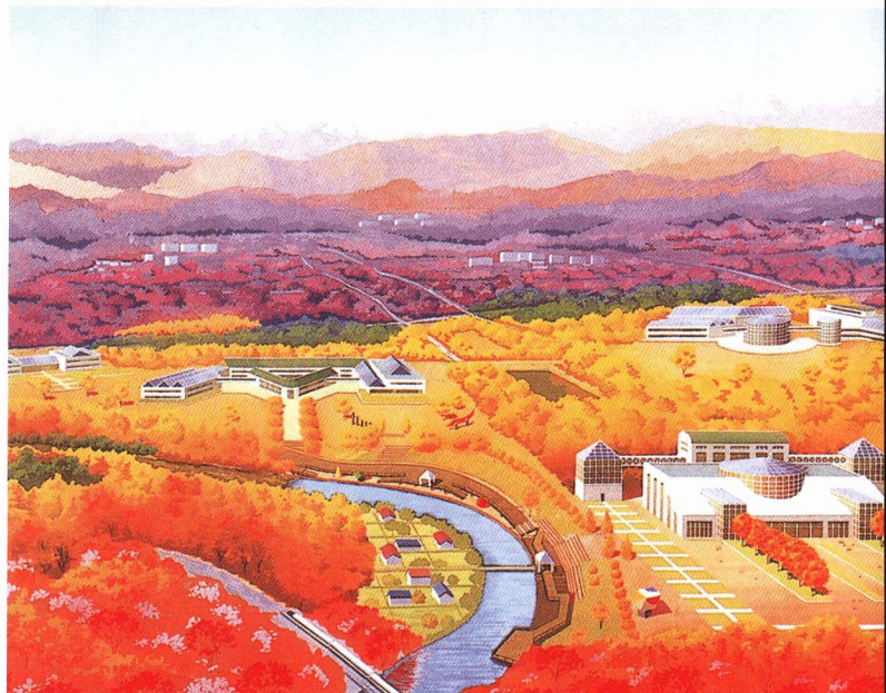
「森にしずむ都市」のイメージ