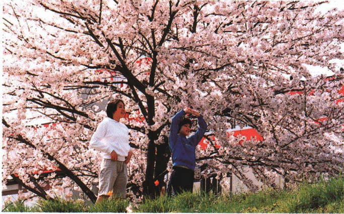
「釈迦堂川の桜」が咲き誇るふれあいロードは、四季を通じてみんなが憩う花と緑の空間です。