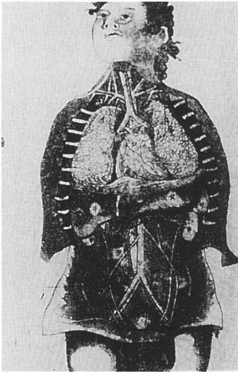
田善の銅版画による解剖図 （『医範提綱』から）