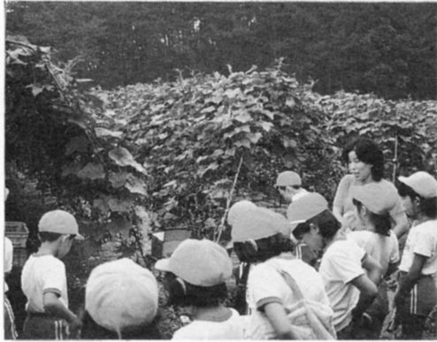
きゅうりのたなをつくります