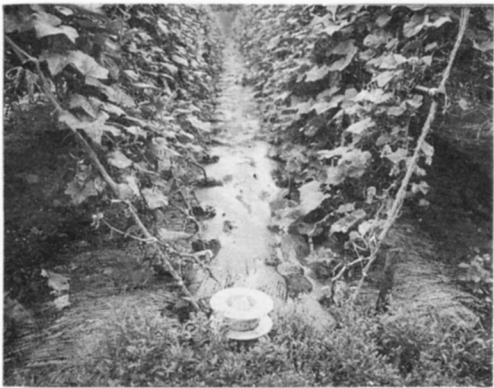
水やひりょうをホースでまきます