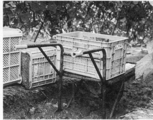
きゅうりを車ではこびます