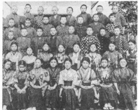
きもので学校に通っていました。(60年ほど前)