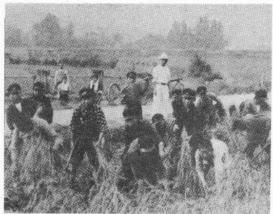
いねかりのじゅぎょうもありました。(50年ほど前)