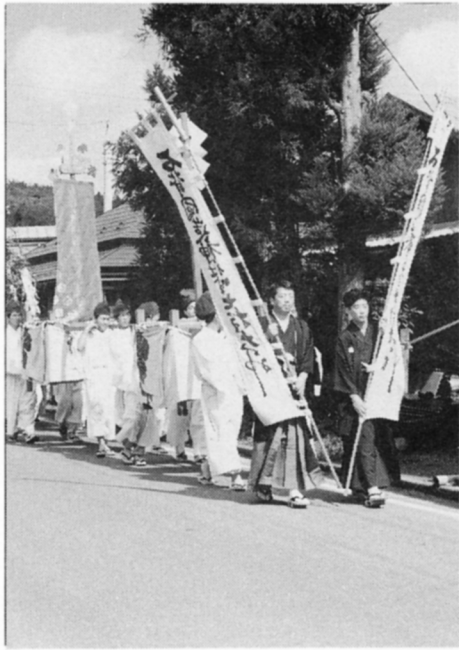
いわせ国のみやつこ神社秋まつり

みこしについたさかきのはをとると、よいことがあるといわれ、人びとはきそってさかきのはを取ります。