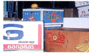
せいさんち 生産地をあらわすもの