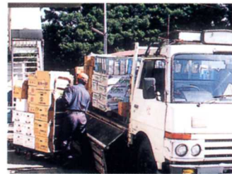
はこ トラックで運ばれる品物