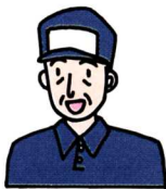
はたらいっている人の服そう

この工場では、いろいろな病気を治す なお ための薬をつくっています。体の中に入る薬なので、品質 ひんしつ に十分気をつけ、えいせいにも気をつけているのです。