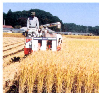
コンバインを使ってのいねかり