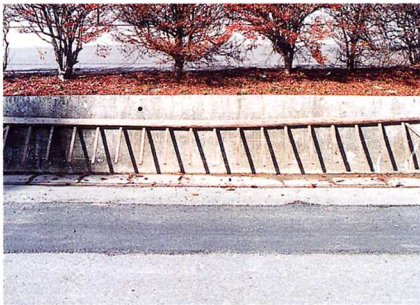
じょうぎ 田植え定規