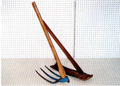
くわ くわ 三本鍬と鍬