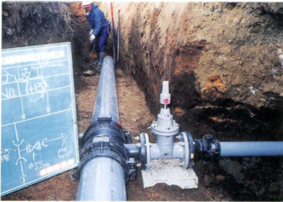
地下の配水管（水道）