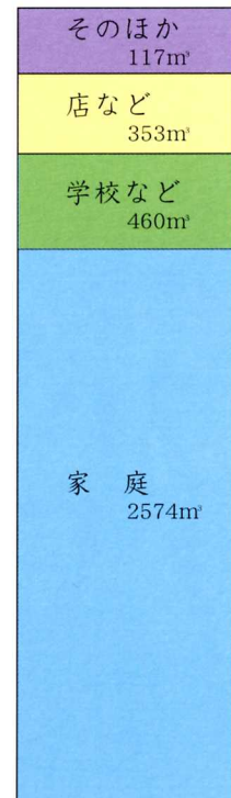
総量3504m 3 町で1日に使われる 水の量 (使われる場所別) 〔2000年度(平成12年度) 鏡石町上下水道課〕