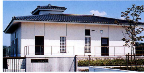
成田じょうかセンター