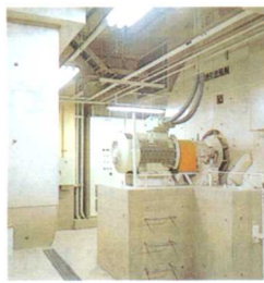
けむりをすいこんでえんとつへ送る