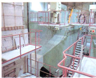
けむりの中からちりなどを取りのぞく

もえるごみは、一日に最大100トンの量を完全にもやし、 はい灰にします。その時出たけむりは、 ゆうがい 有害な物をできるだけ 取りのぞき、えんとつから外へ出されます。もえる時に 出た熱は、衛生センター内の ゆ だんぼうや、お湯として利用 しています。