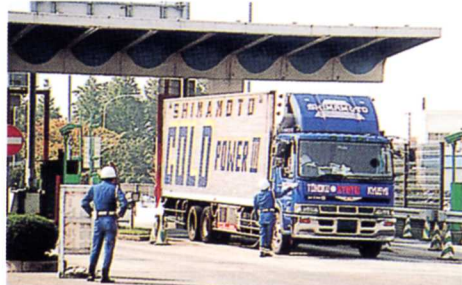
インターチェンジでの交通取りしまり