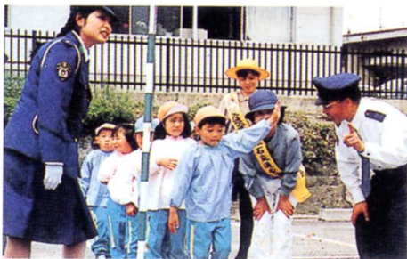
幼稚園での交通教室