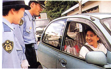
シートベルトの呼びかけ