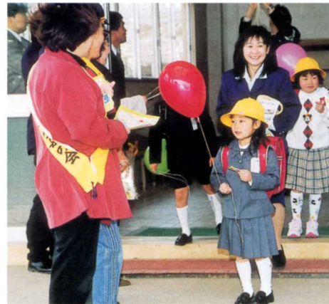
交通安全母の会の活動