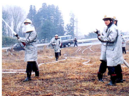
くんれん 消防団の消火訓練