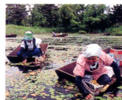
ジュンサイとりのようす

「福島県の広さは、日本で3番目で、面積のやく3分の2は山地です。県の北と西の山形県や新潟県のさかいに高い山々があります。」