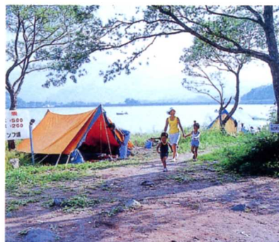
夏にキャンプを楽しむ人々