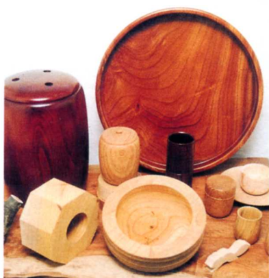
北塩原村の木工品

「裏磐梯にスキーに行きました。新かん線や高速道路ができて、ほかの県から来る人も多くなってきたそうです。ジュンサイやきのこも作っていておいしかったし、木工品もおみやげに買ってきました。」