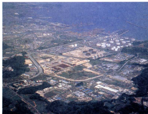
小名浜臨海工業地域（いわき市）

1964年（昭和39年）に、いわき市や郡山市を中心とした地区は国から新産業都市に定められました。