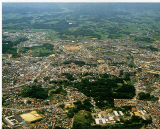
そらから見た須賀川市

須賀川市では、羽鳥湖や猪苗代湖の水のりようで、水田や 畑が多く、きゅうりやくだものさん地になっています。