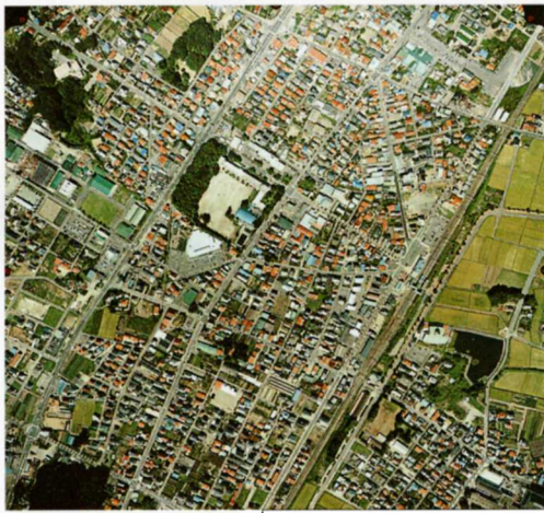
空から見た鏡石町