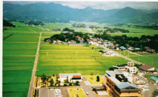
水田が広がるようす