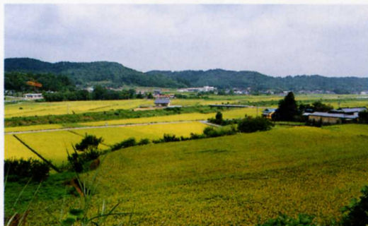
役場のまわりの水田