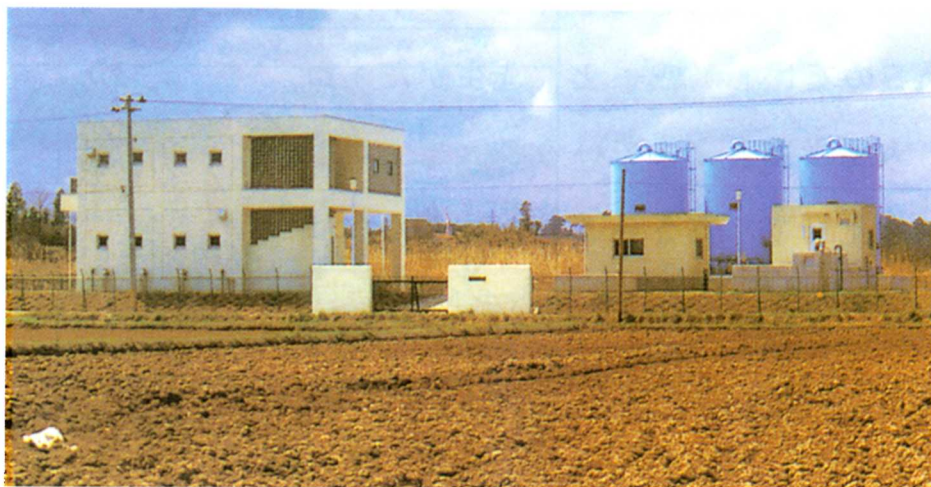
いわぶちじょうすいじょう 岩淵浄水場