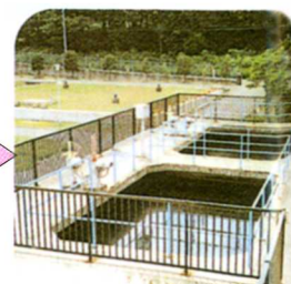
きゅうそく かち 急速ろ過池 砂でろ過する。