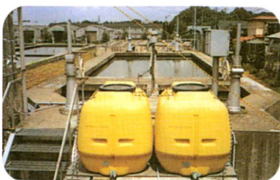
ちんさ 沈砂池 大きなごみをしずめる。