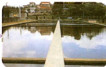
やくひん 薬品沈でん池 薬を入れてまぜ、水の中 のごみをしずめる。