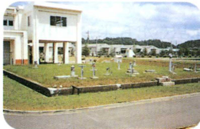
じょうすいち はいすいち 浄水池・配水池 のめるようになった水を使用量だけおくる。