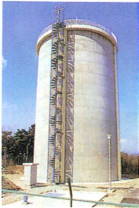
せりざわはいすい 芹沢配水とう