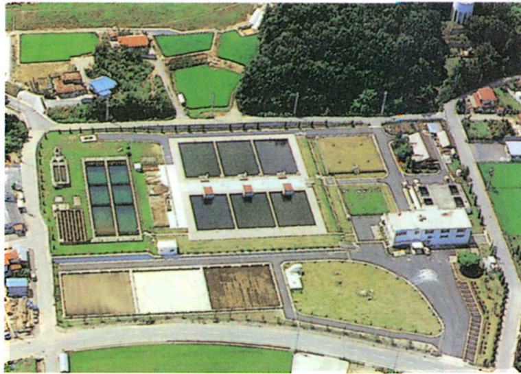
にしかわじょう 西川浄水場