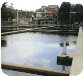
かんそく かし 緩速ろ過池