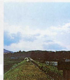
田の上を流れる用水路。