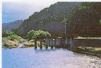
隈戸川にせきを作り、用水路へ流す。