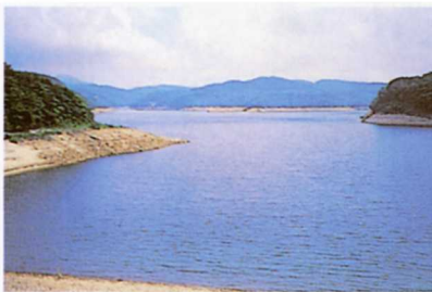
鶴沼川をせきとめてできたおおきなため池。(羽鳥貯水池)