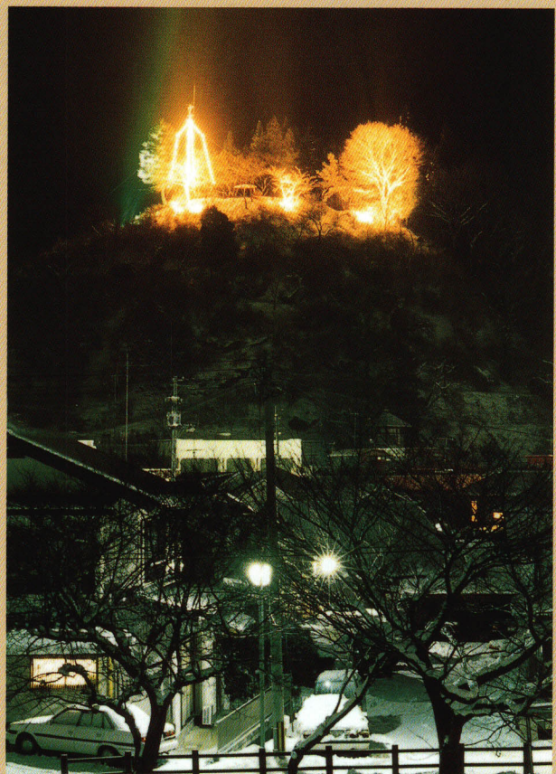
石尊山のイルミネーション