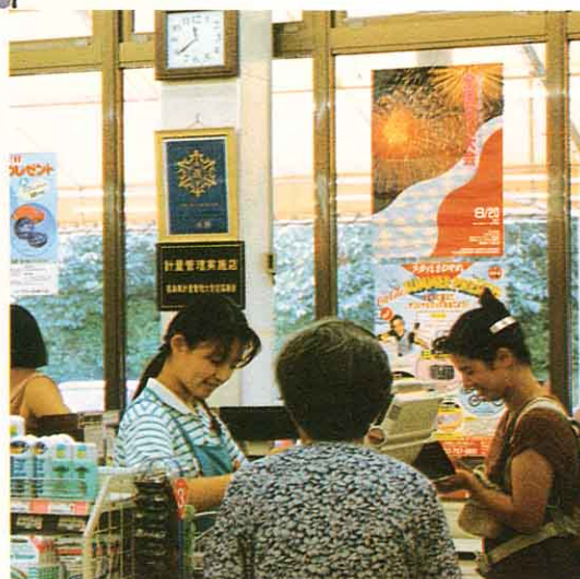
レジでお金をうけとる