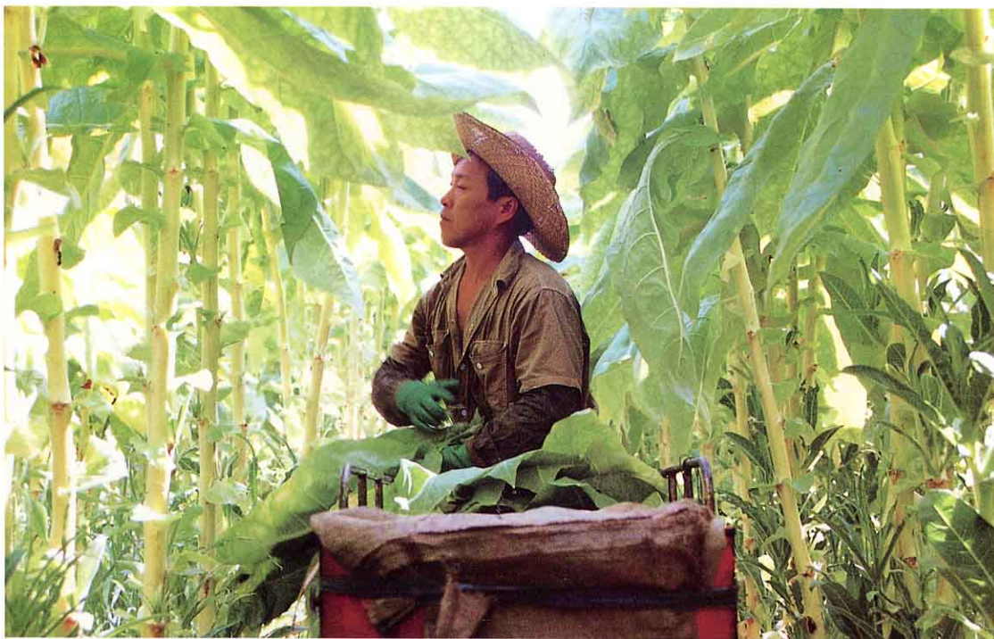
葉たばこのしゅうかく

「店のしなものは、いろいろなところから運ばれてくることがわかったけど、わたしたちの町では、どんなものが作られているのかしら。」