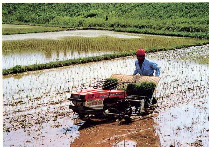
きかいて田うえをする。