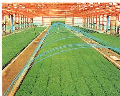
なえ床になえをつくる。