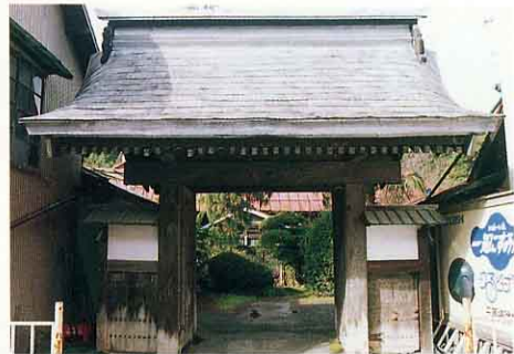
江戸時代にたてられた大庄屋の門(荒町) おおしょうや 明治の自由民権家鈴木重謙宅