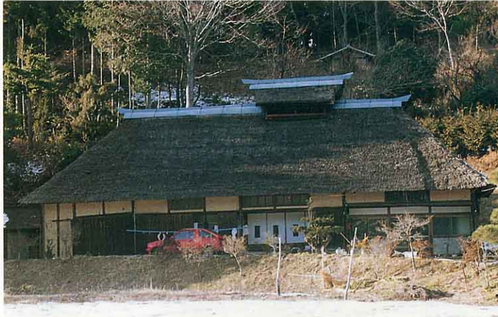
江戸時代からのこっている農家(中谷地区)