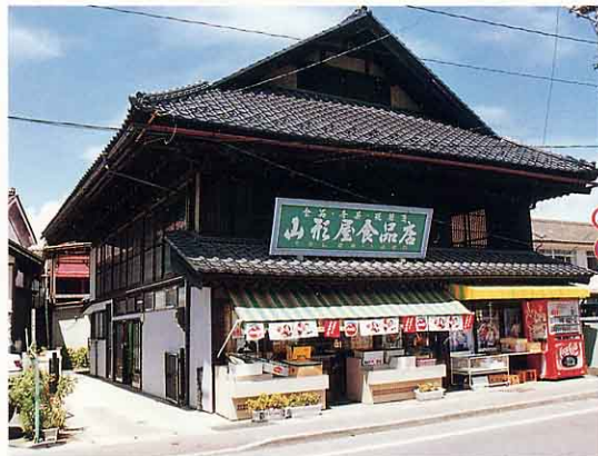
明治時代にたてられた古い店(荒町) あらまち