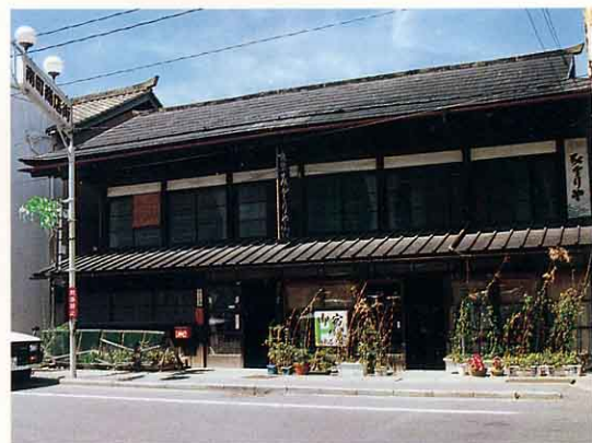
江戸時代にたてられたやど(南町) えど