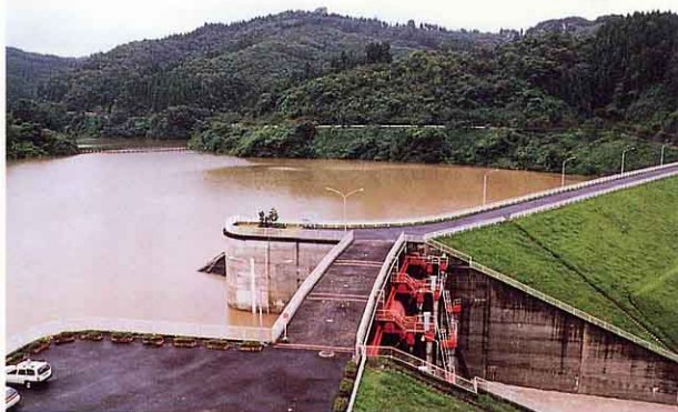
千五沢ダム(母畑ダム)