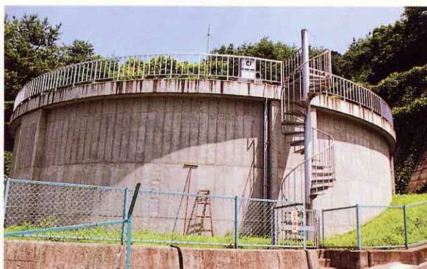
はいすい ち 配水池