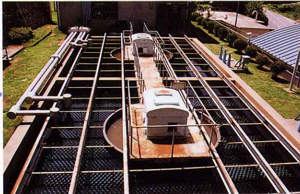
こうそくちんち 高速沈でん池

小さなゴミをまぜてフロックとよばれるかたまりにしてしずめます。すなを通してきれいな水にします。