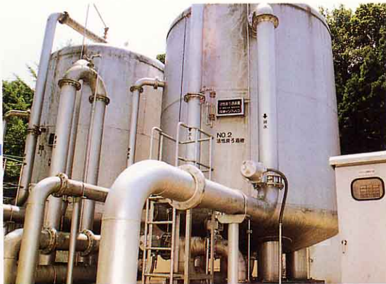
かっせいたんかき 活性炭ろ過機