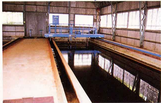
きゅうそくかち 急速ろ過池

小さなゴミをまぜてフロックとよばれるかたまりにしてしずめます。すなを通してきれいな水にします。