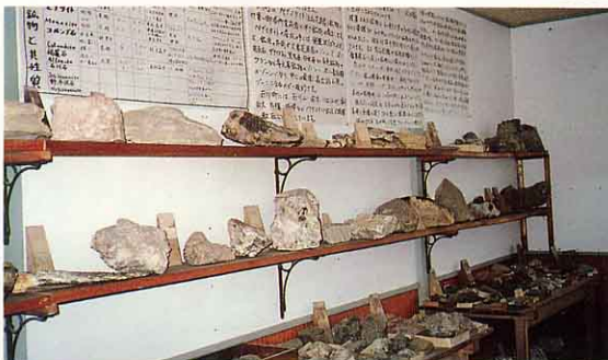
学法石川高校 鉱物館内

「石川は日本三大鉱物産地の第 一番目にきます。(他に岐阜県苗 木、滋賀県田ノ上山)石川の石は 全国各地をはじめ、外国の博物 館や標本室に展示されているほ ど有名なのです。」