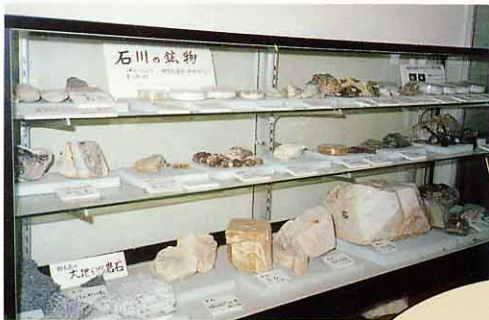
野木沢小の石の展示 ケース