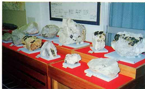
石川町立歴史民俗資料館の展示室