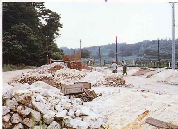
野木沢駅に集められた長石・石英 (昭和30年代)