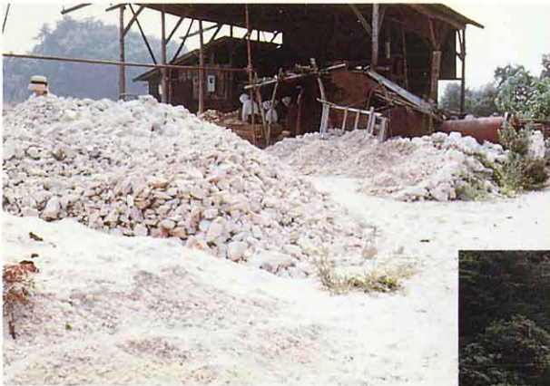
じょうばん こうざん 常磐鉱山 (町内塩沢字大石にあった)