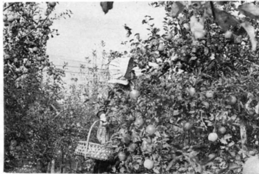
りんごのしゅうかく