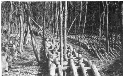
しいたけさいばい