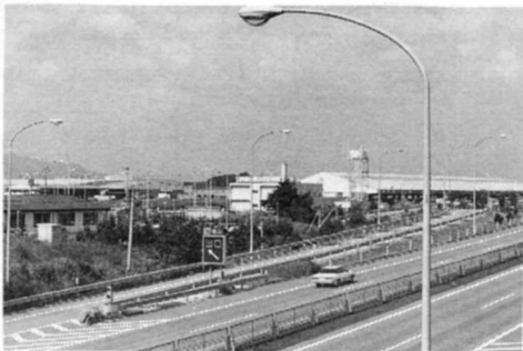
トラックターミナル