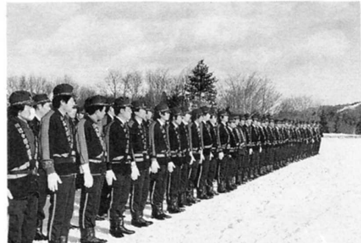
毎年行う消防団の出初め式