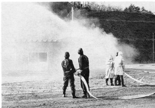
消防団のくんれん