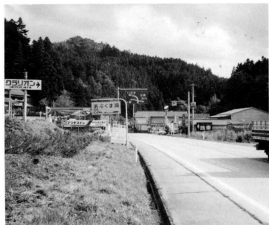
49号国道と349号国道の交わった所