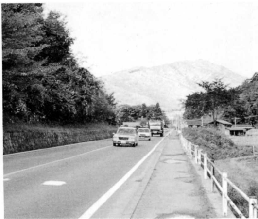
国道49号線は、平田村の“大動脈”

国道 (49号線、349号線) 県道 (北方、遅沢線) 村道 (鶉子線) 主要地方道 (石川・平田線)