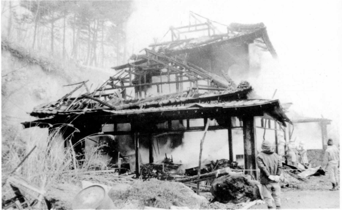
村で1年間におきる火事の数 (66-2)