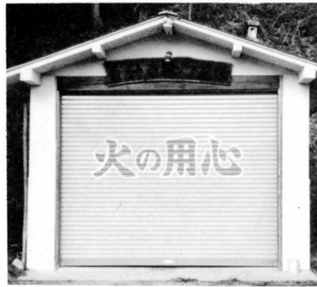
消防団のポンプ自動車置場