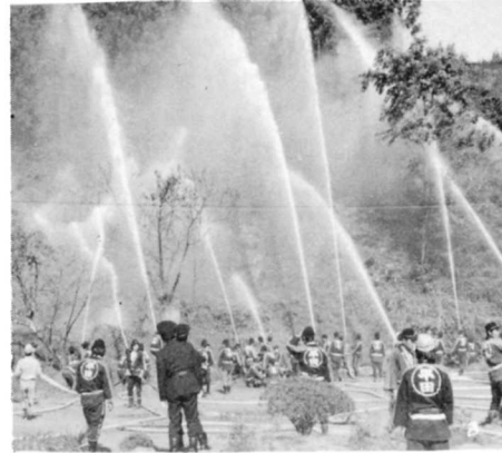
消防団のくんれんの様子