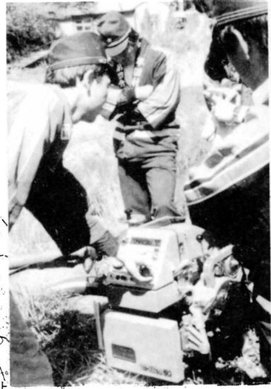
新しいポンプの取り扱い方を学ぶ団員たち