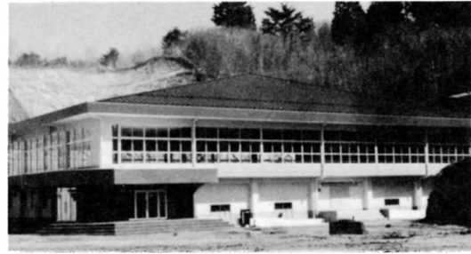
勤労者体育センター