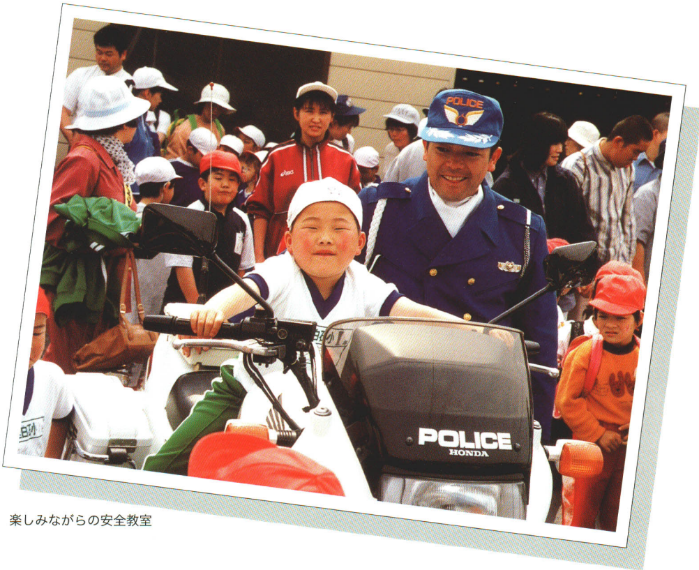
楽しみながらの安全教室

人間尊重の理念のもと、 交通道徳に基づいた安全意識の高揚を図るとともに、 防災・防犯体制の確立に努めています。