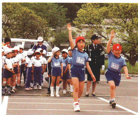
地域ぐるみの交通安全対策