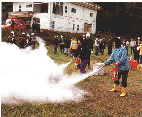
備えあれば憂いなし

防災・防犯については、町民一人 ひとりの意識の徹底を図り、未然に 防ぐ体制づくりを確立していくと ともに、防災時にも活用できる コンピュータを使ったネットワーク構 築にも努めていきます。