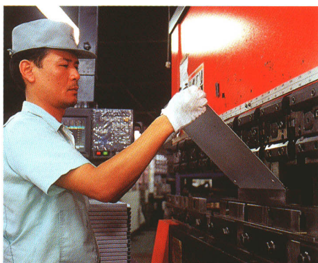
ハイテク工場など、企業誘致を積極的に展開