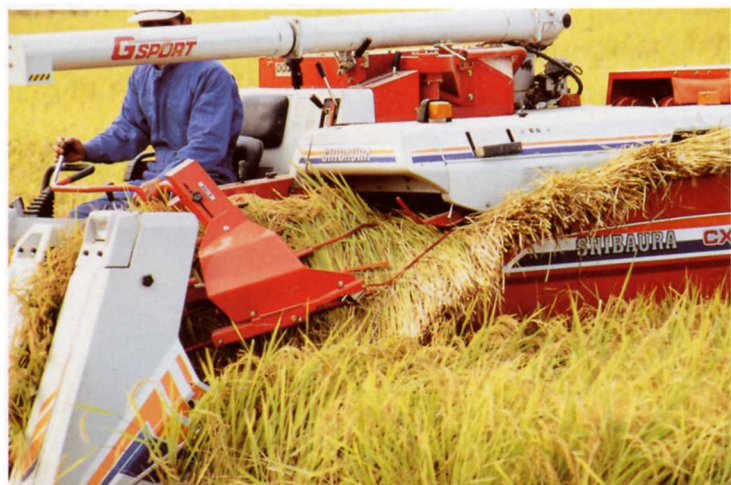
きかいでいねかりをする