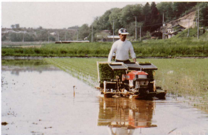
きかいで田うえをする

さいきんは、6条うえなど大がたのきかいでうえますが、小さい田は手でうえています。