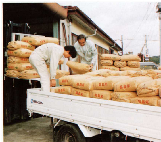
そうご 倉庫におさめられる米